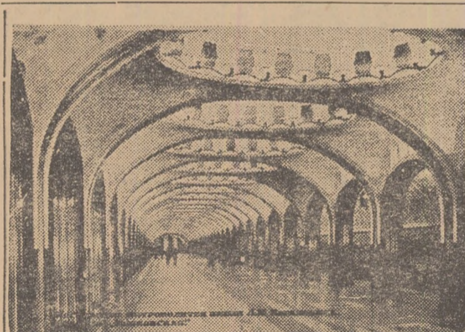
Metrourile din Moscova: Aspect din stația „Maiacovskii”

De sus, de la etajul 24, cînd privești deasupra, vezi turnurile celor 37 corpuri de clădiri și chiar deasupra capului se înalță turnul principal avînd în vîrf steaua minunat strălucitoare a Universității; cînd privești în jos pînă departe vezi rîul Moscova deasupra căruia joacă vaporii de apă, pe malurile căruia se desfășoară grandios, bulevardele, construcțiile noi de locuințe muncitorești, iar mai departe — Kremlinul. În spate, vezi parcurile verzi cu aleele roșii (presărate cu praf de cărămidă), ale căror linii perfecte îți fac impresia că te uiți la un desen arhitectural al unui mult talentat arhitect. Totuși pentru a ne încredința simțurile de realitate — ne-am plimbat peste cîteva minute prin aleele acelea, și ne-am fotografiat pentru amintire neștersă!