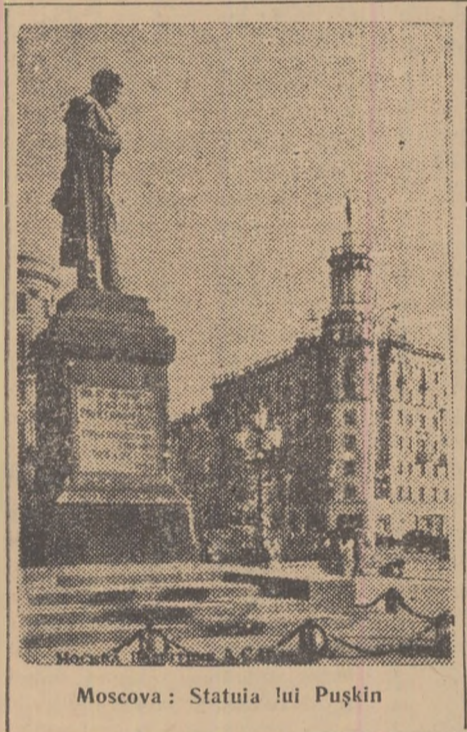
Moscova: Statuia lui Pușkin

Ne-am oprit o clipă, să ne îndreptăm din nou spre așteptarea de aproape de ei — și am ieșit, tăcuți și îngîndurați.