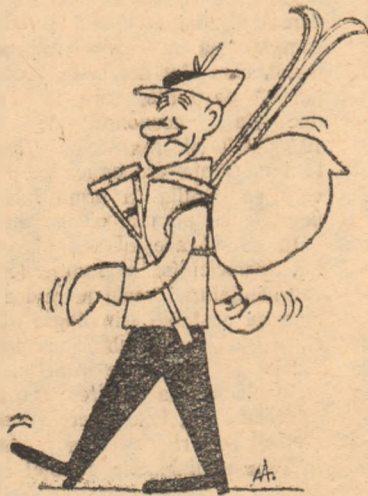
Parîndul pleacă în seară.

Ca urmare a discuțiilor și propunerilor făcute de către comunisti în scopul îmbunătățirii disciplinei în producție, adunarea generală a organizației de bază a adoptat un program de măsuri cu sarcini și responsabilități precise pentru fiecare membru și candidat de partid.