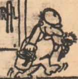
Desene de A. Andreaco

ACTIVITATEA ARTISTICA LA COMITATUL CULTURAL