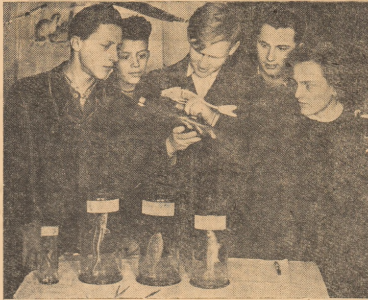
O grupă de elevi de la Școala medie din O.M. repetind cu ajutorul materialului didactic lecția de zoologie.