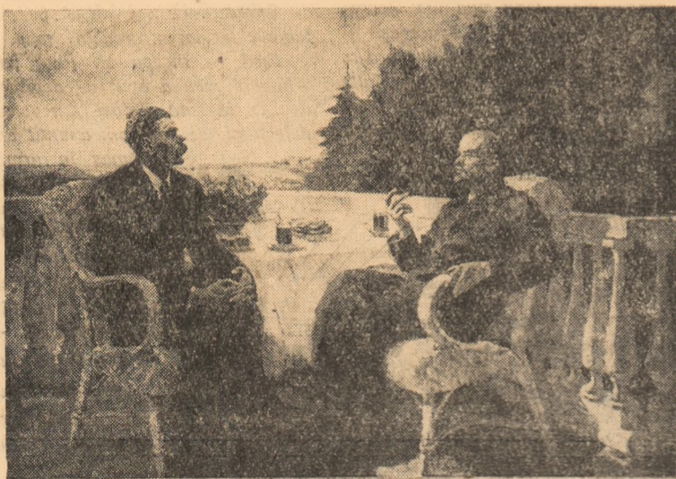
În foto: Tabloul pictorului sovietic V. Efanov: „V. I. Lenin și A. M. Gorki la Gorki.”

M-am întîlnit din nou cu Siberia în cel de-al 75-lea an al vieții mele, în zilele cînd se desfășurau lucrările istoricului Congres al XXI-lea al Partidului Comunist al Uniunii Sovietice. De astă dată m-am întîlnit cu Siberia septenului. Ce încredere mare în puterea statului nostru socialist în forțele poporului sovietic trebuie să aibă partidul comunist pentru ca nu numai să propună un asemenea program grandios, dar și să fie ferm convins că el va fi îndeplinit!