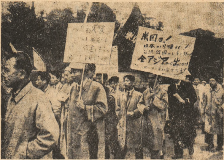
La Tokio, capitala Japoniei, au ajuns după un marș de 58 de zile în care timp au parcurs 1.400 km. participanții la marșul popular împotriva războiului și a șomajului. În F.C.I.O.: Participanți la marș.