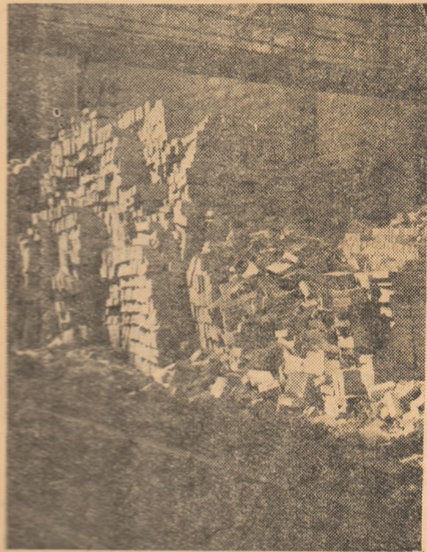
Conservarea materialelor stă în atenția tuturor care luptă pentru înflorirea orașului nostru. Mai sînt însă unele cazuri unde se observă neglijența totală pentru conservarea materialelor.

Iată un exemplu grav. O stivă destul de mare de cărămizi refractare, care se află între furnalul 4 și 5, lăsată pe o perioadă îndelungă, are început să se distrugă. Oare organele competente nu se gîndesc că această cărămidă a fost făcută „gri“ și că nu trebuie lăsată să se distrugă? Dacă nu s-a gîndit la acest lucru e bine ca în momentul cel mai scurt să ia măsuri și să conserveze acest material pejos pînă nu este prea târziu.