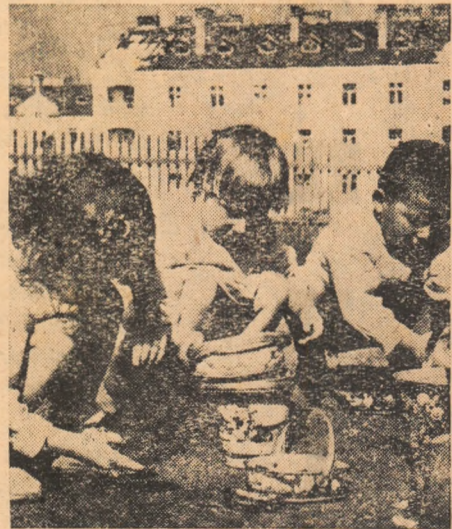
Copiii siderurgiștilor și constructorilor hunedoreni cresc sub îngrijire permanentă la creșele săptămîinale și căminele de zi ale întreprinderilor. În fotografiile alăturate vă prezentăm cîteva aspecte din activitățile zilnice ale copiilor.