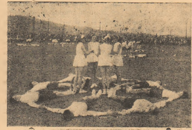
Intrecerile formațiilor artistice

Pe scena din grădina de vară „Filimon Sirbu” încep să se întrecă la ora 11 a.m. formațiile artistice ale întreprinderilor și instituțiilor din orașul nostru.