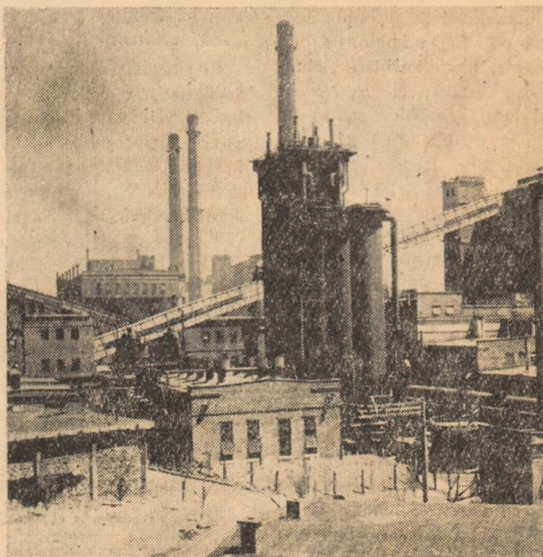
NOI UZINE RIDICATE ÎN ANII PUTERII POPULARE