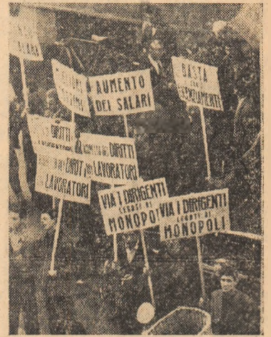
Demonstrație de protest a muncitorilor metalurgiști din cartierul San Giovanni (Italia).