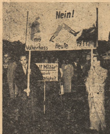
De curînd a avut loc la Hamburg (R.F.G.) o mare demonstrație de protest împotriva recrutării forțate a tinerilor născuți în anul 1952. IN FOTO: În timpul demonstrației împotriva recrutărilor din R. F. Germană.

Străpungind scoarța pămîntului geologii și minerii sovietici scot la suprafață bogățiile lui, pentru ca, cu ajutorul tehnicii și al priceperii lor să folosească fiecare gram de pămînt care conține minereu pentru a-l transforma în metalul septenalului.