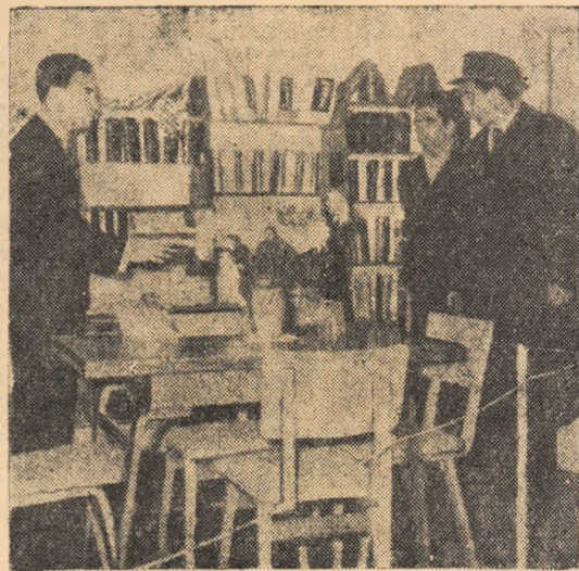
In foto: Aspecte de la expoziția „Modele noi de mobilă” organizată de Ministerul construcțiilor, materialelor de construcție și industriei lemnului în O.M. Hunedoara.