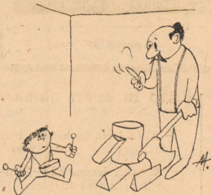
— Cintă mai încet lonele, că e tirzlu, și s-or fi culcat vecinii!!!