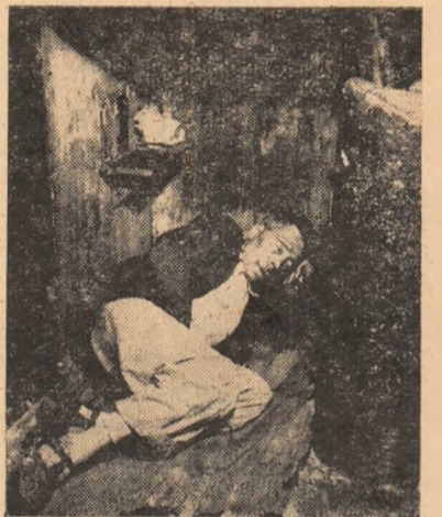
„Culcușul unui muncitor din orașul Neapole. Această „lucru-ință“ se află în oraș.“

ADDIS ABEBA (Agerpres). „Africa de sud este un regal al spaimei“, scrie în paginile ziarului „Erythopian Herald“, businessmanul vest-german Arthur Bernhard, care este de doi ani reprezentantul unei firme vest-germane în Africa de sud-vest și în Uniunea sud-africană. Bernhard, care se află în prezent la Addis Abeba, vorbește în articolul său despre crunta asuprire rasială a populației locale din aceste regiuni africane. „Africanii, scrie el, sint tratați mai rău decât robii“.