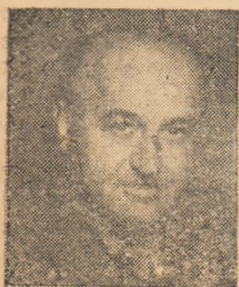
DRAGO ARTUR director O.C.L. industrial