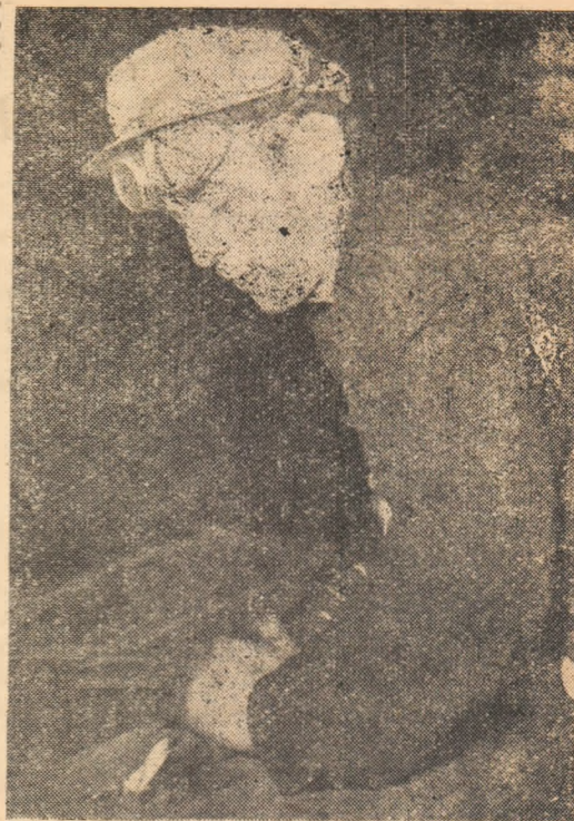
Utemistul Bărbulea Pompillu care lucrează la bluming 1.000 este unul dintre pistolarii fruntași de la acest laminor. El depășește zilnic norma cu cel puțin 3 la sută.