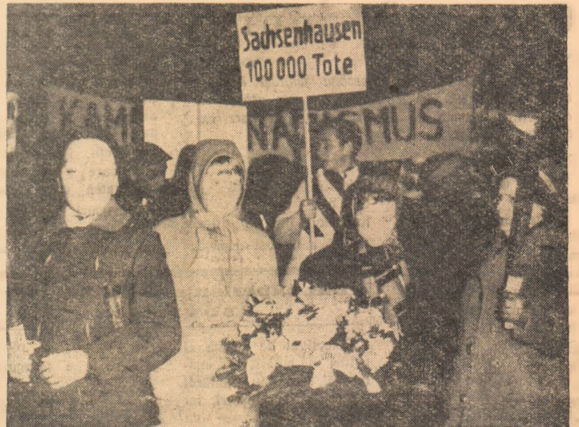
O demonstrație cu torțe la Hamburg împotriva reînvierii fascismului în R.F.G.

Hadzime Noguti, comentatorul agenției Kikansî, scrie într-un articol publicat la 25 martie că Adenauer intenționează să se consulte cu premierul Kișî în ceea ce privește crearea axei Washington — Bonn — Tokio.