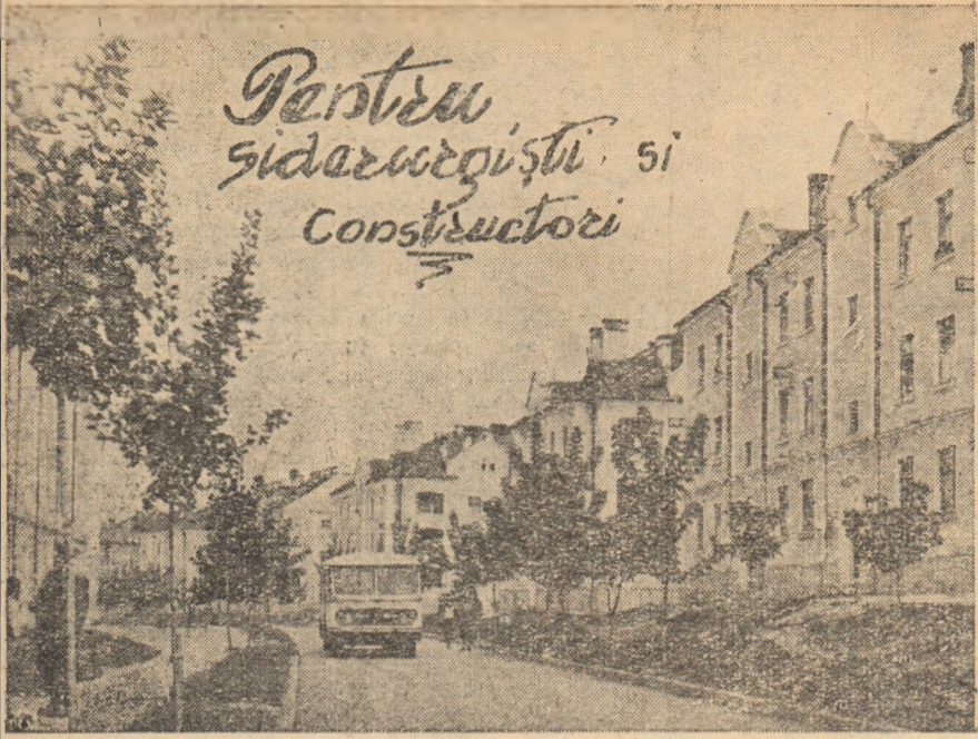
IN FOTO: Un aspect din noul oraș muncitoresc, construit la Hunedoara, în anii puterii populare.