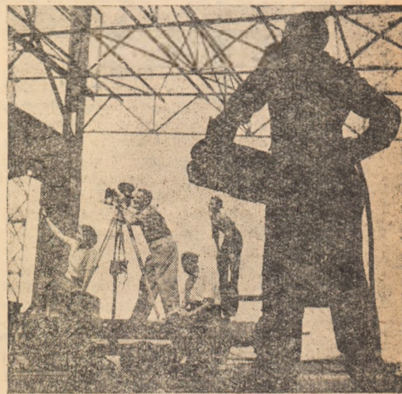
Membrii cinematoclubului amator din orașul nostru la lucru pe șantierele Hunedoarei.