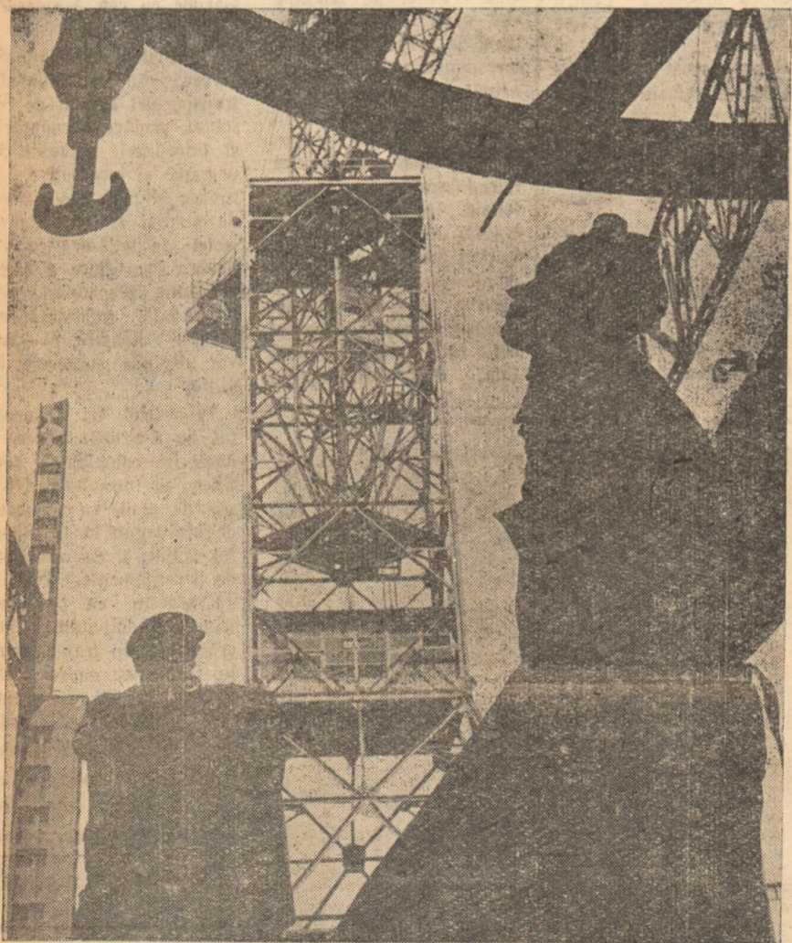
Zilele acestea primul cuptor de 400 tone de la noua oțelărie Martin, a dat cele dintîi șarje. Construcția celorlalte continuă. Redăm în clișeu de mai sus un aspect din munca constructorilor.