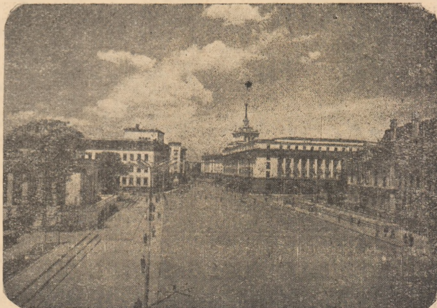
Bulevardul principal al Sofiei