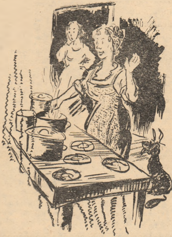
GOSPODINA: — Te invit să gătești astăzi la mine. Faci economie!

Există în orașul nostru un număr de cetățeni care folosesc instalații electrice nedecaritate cu un mare consum de curent, cauzînd prin aceasta o risipă însemnată.