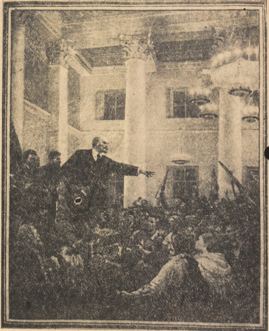
V. I. LENIN PROCLAMIND PUTEREA SOVIETICĂ

Mă duc întins să le spun soldaţilor că am vorbit adineori cu Lenin. Da. Trebuie neapărat să ne batem chiar azi... chiar acuma..