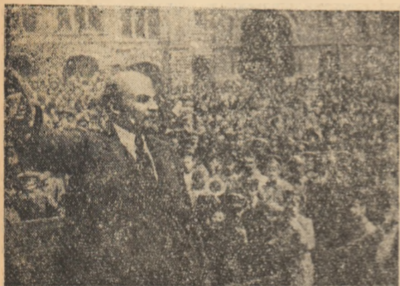
V. I. Lenin rostind o cuvîntare în faţa detaşamentelor formate în ca drul insurecţiei militare.