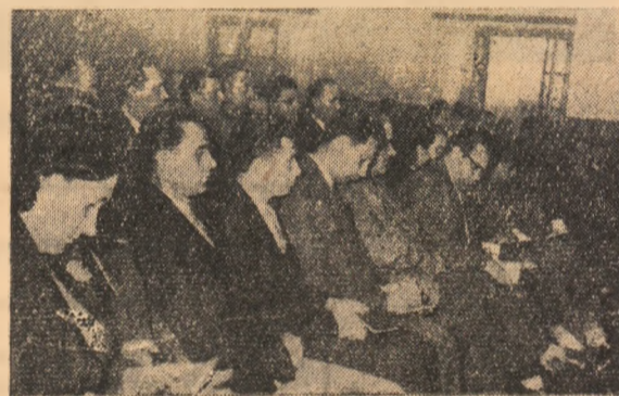
Un aspect din sală.