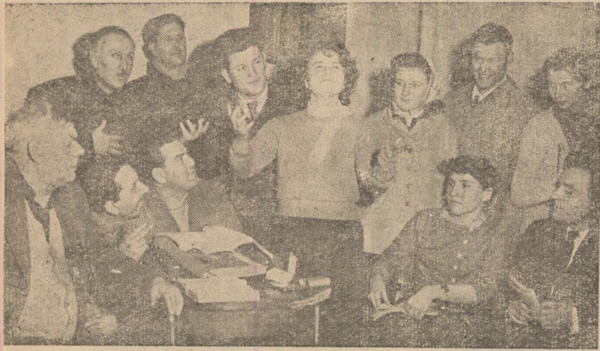
„Pe vremuri la alegeri“ este tema programului pe care brigada artistică a clubului muncitoresc din Călan îl pregătește intens