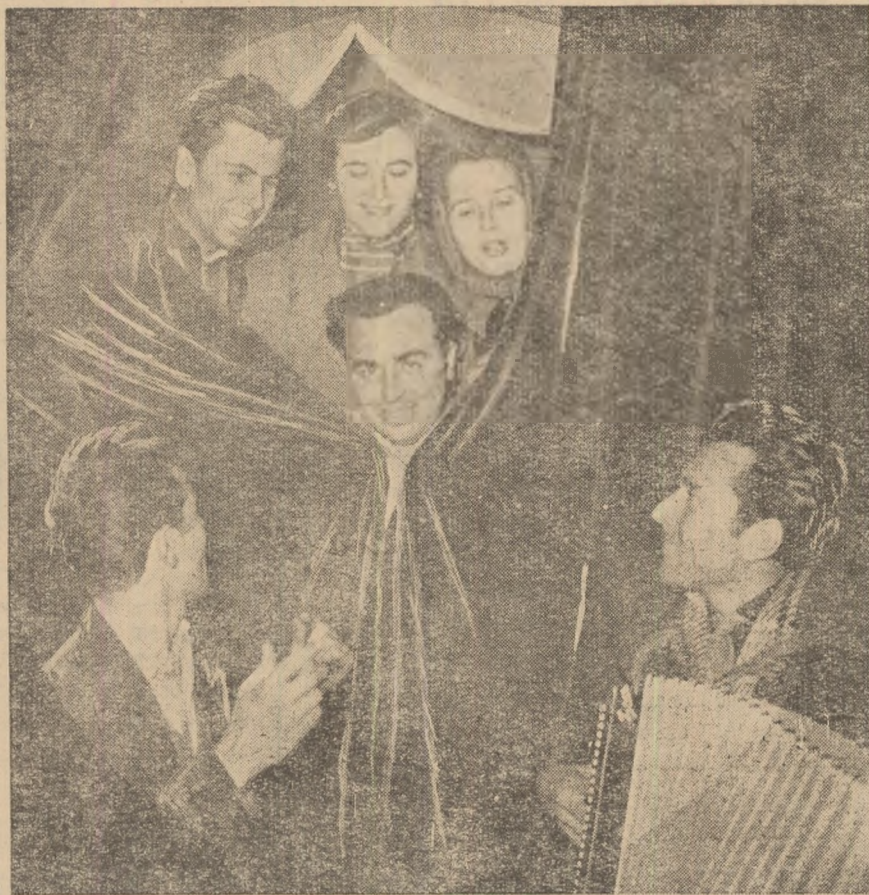
Brigada artistică de agitație a căminului cultural din satul Batiz pregătește un nou program dedicat alegerilor din 5 martie.