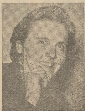
nit 18 ani vor vota la 6 martie pentru prima oară. Iată-i pe trei dintre aceste