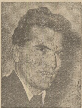
Alături de multe alte mii de tineri cetățeni din patria noastră, tinerii din satul Balta care au impli-