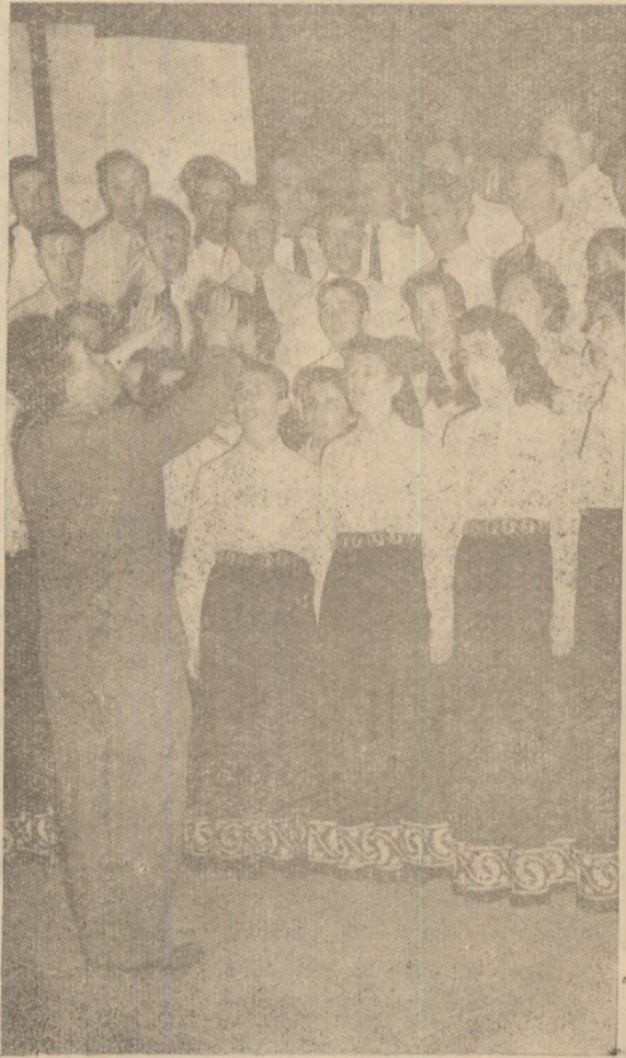
În foto: Corul întreprinderi miniere Ghelar.