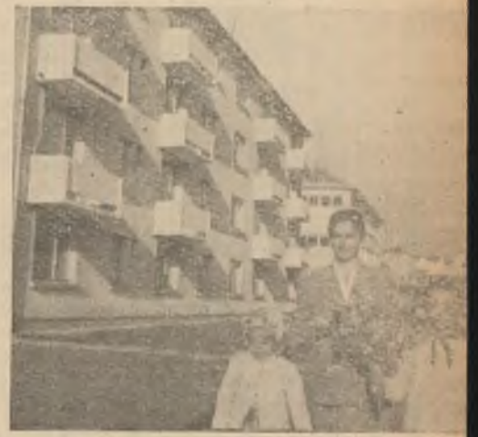
Orașul nostru înflorește cu fiecare zi ce trece. Mutarea într-un bloc nou a devenit un fapt de rutină al acestor zile.

Această „înțelegere” a nevoilor constructorilor, pune piedici în calea sporirii ritmului de construcții, duce la cheltuieli inutile și creează condiții anormale de lucru. Trebuie să se țină cont că proiectele sosesco cu întârziere și în acest caz cel puțin terenul unde se amplasează noile construcții să fie pus la dispoziția constructorilor din timp.