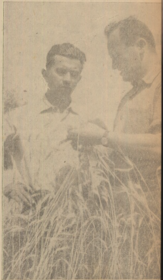
...Se poate începe recoltatul grîului.

— Știind că zootehnic — reținerile — constă în înțelegerea de mari