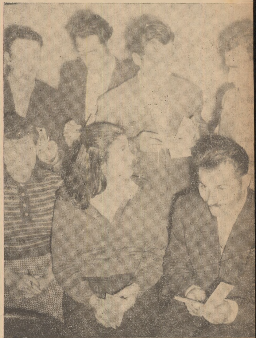
Un grup de constructori discutînd în una din pauzele conferinţei.

Darea de seamă prezentată de tovarăşul Covalio-