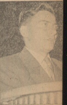
FRANKFORT TIB secretar al comit orașenesc de pa