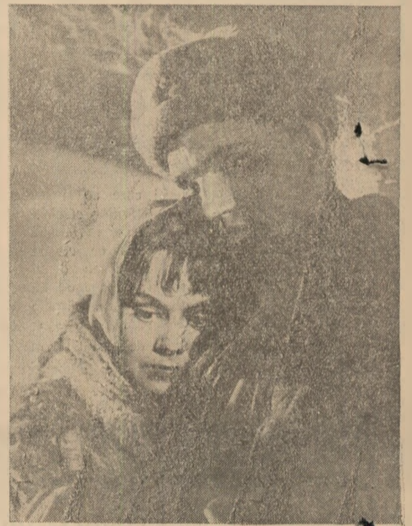
Scenă din film

Caracterul tumultuos plin de viață al eroului principal, știind să se bucure adînc, să iubească profund și să su-