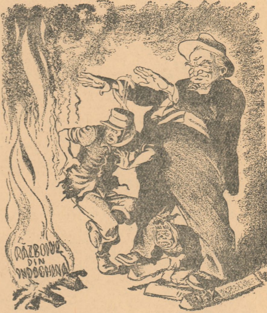
lată o „colaborare” și obșnutilui „ajutor” de peste mare: