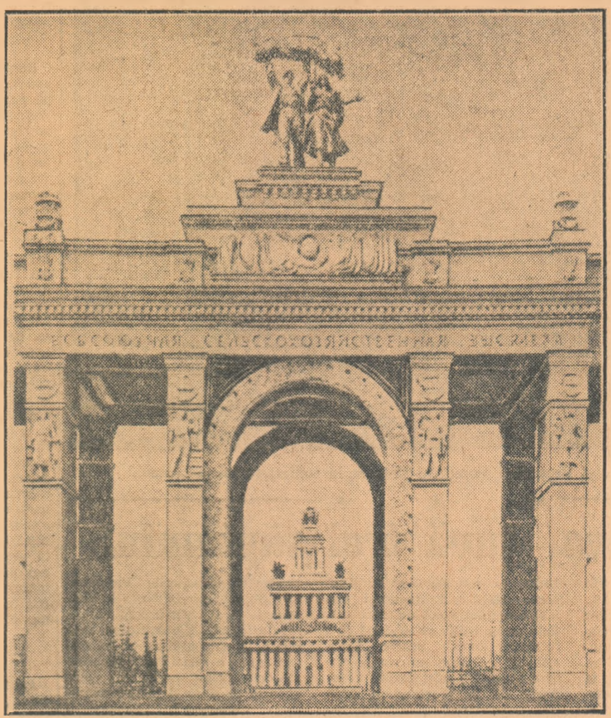
La această desfășurare sârbătorească a tehnicii sovietice...