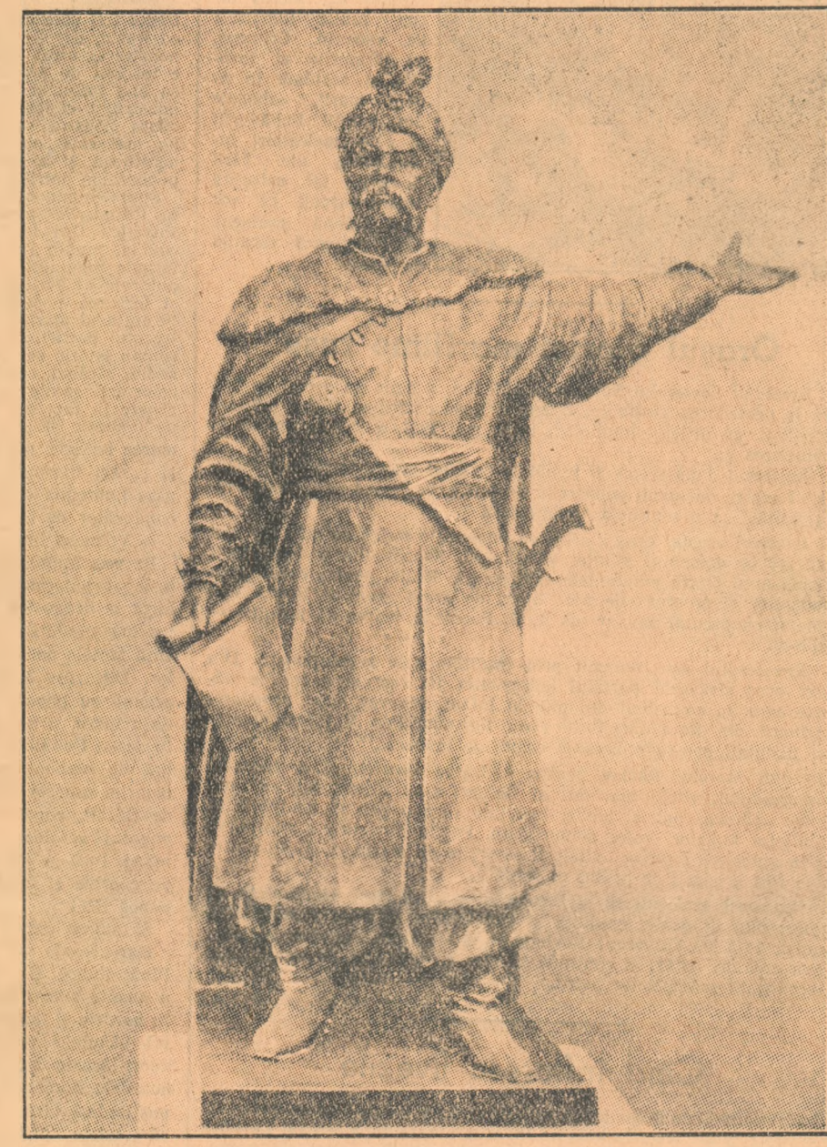
„Bogdan Hmelnițki”, sculptură de V. VINAIKIN