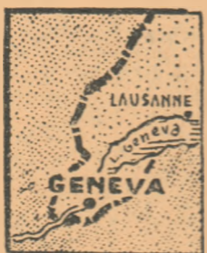
Geneva și zona înconjurătoare...