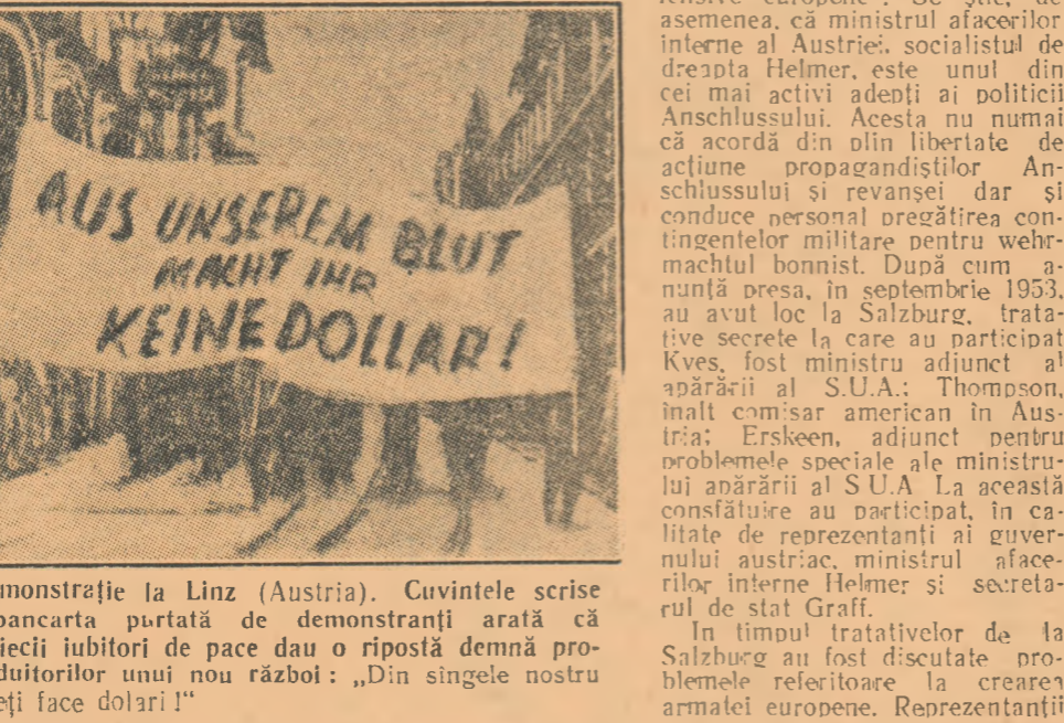
Demonstrația de la Linz (Austria). Cuvintele scrise pe pancarta purtată de demonstrații arată că austriecii iubitori de pace dau o ripostă demnă...