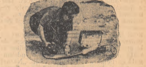
mele zvîltă, de statură mijlocie, care urca cu o deosebită îndemînare. Ea ocolea cu prudență crăpăturile adînci, în care strălucea masa scilpitoare de foc. În acele ore cînd craterul „se odihnea”, femeia cobora în adîncitura gigantică, studînd structura ei, lua mostre de lavă și gaze...

Dar îndată ce lava a prins o poșghîță subțire, pe suprafața ei a putut fi zărită o se-