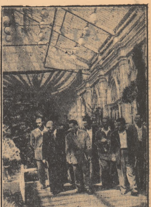
Membrii delegației Republicii Populare Romine, vizitînd pavilionul Horticulturii din Expoziția agricolă unională de la Moscova.

Acum, în centrul atenției colhoznicilor din artelul „Budionni” e stringerea recoltei într-un termen scurt și fără pierderi și lupta pentru îndeplinirea urgentă a sarcinilor ce-au fost trasate agriculturii de Partidul Comunist și Guvernul Sovietic.