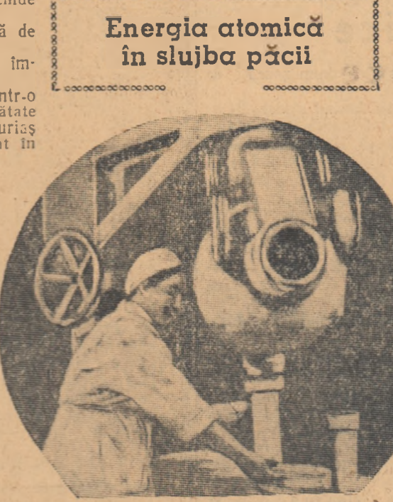
„GUT - 400”

ESTE NECESAR UN SCHIMB DE EXPERIENȚĂ PE SCARA INTERNAȚIONALĂ Ziua de lucru la secția de terapie cu raze s-a terminat. Dar medicii s-au adunat într-un birou și nu se grăbesc să plece. Ei discută despre soarta științei căreia fiecare din ei i-a consacrat viața. Pe medicii radiologi îi interesează mult toate științele despre energia atomică. Ei cunosc prea bine atît forțele destrucțive cit și forțele binefactorice ale atomului dezagregat și, de aceea, se bucură neapuse de fiecare acțiune întreprinsă de Guvernul Sovietic pentru folosirea pașnică a energiei atomice.