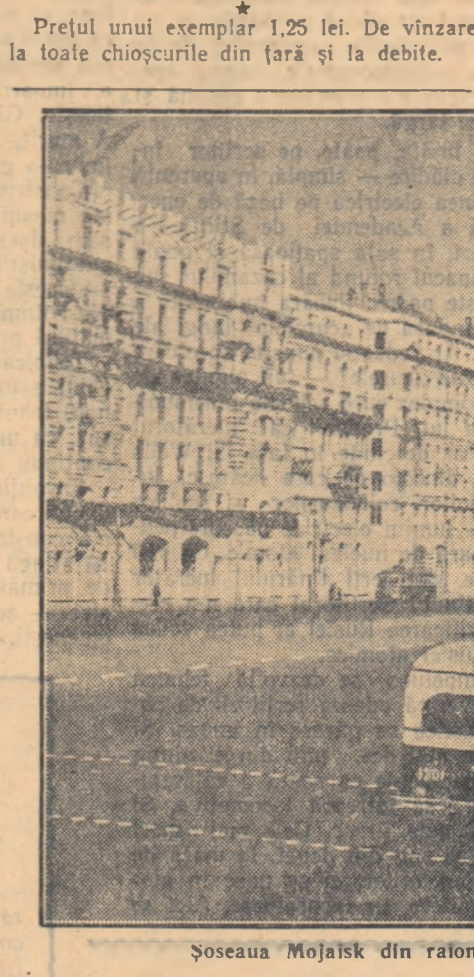
Șoseaua Mojaisk din raionul „Klev” at Moscova.

Prețul unui exemplar 1,25 lei. De vînzare la toate chioșcurile din țară și la debite.