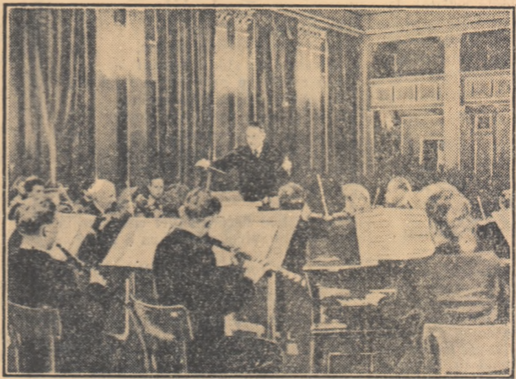
Orchestra simfonică a Institutului Politehnic „S. M. Kirov” din Sverdlovsk, în timpul unei repetiții.

Vorbînd despre muzică, nu se poate să nu amintim de cunoscutul Cor de stat din Ural, care a luat ființă aici, în Sverdlovsk. Cîntecele lui au răsunat nu numai în Ural și Siberia; melodiele lor au încîntat pe ascultătorii din Moscova și Kișinău, pe cei din Leningrad și Erevan. Și nu numai în Uniunea Sovietică își are acest cor admiratori. Cu multă dragoste au