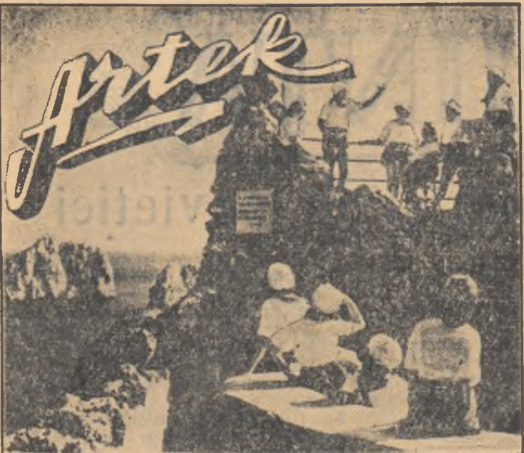
Se-nalță steag după steag și-i negură în Ain-Dag. Te cîntă și munții. Artek neuitat, Artekule drag.

Acet cîntec răsuna la adunările pionierilor din Arhanghelsk și Taşkent, Kiev și Habarovsk, în stepele cazahe și în taiga siberiană. Această melodie e cunoscută de copiii mongoli și de elevii chei.