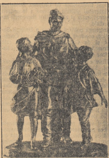
M. COȘAN: „În împlinirea ostașului sovietic” (sculptură)

În viitor, noi ne propunem să realizăm o instalație de studio care să lucreze cu standardul sovietic de 625 dungii și să poată reda o imagine mult mai clară, de calitate superioară altă de pe pelicula cinematografică, cît și din studio. Cu sprijinul partidului și al guvernului nostru, datorită căruia a putut lua ființă această stațiune experimentală de la București, bucurîndu-ne de ajutorul frățesc al Uniunii Sovietice, televiziunea va progresa și în țara noastră în anii ce vin, izbutind să devină un adevărat dar al științei și tehnicii făcut celor mai largi mase ale poporului muncitor.