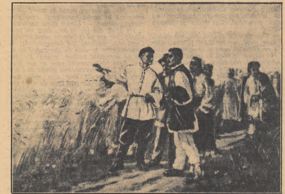
ION COSMA „Taranii romini în vizită la un colhoz în U.R.S.S.” (pictură)