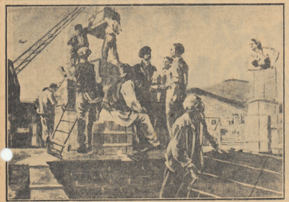
SIMONA VASILIU „Nea sosit uitaj sovietic” (pictură)