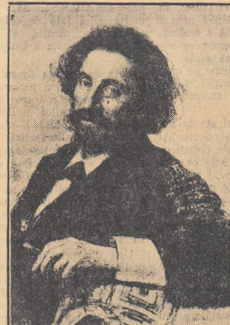
I. REPIN: Autoportret.

Dintre compozițiile cu temă socială, cea mai însemnată este fără îndoială „Procesul” religios din gubernia Kursk”, care aduce o viziune realist-critică asupra societății rușești de pe la sfîrșitul veacului trecut.