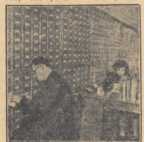
Unul din fișierile Institutului de informație științifică

De la referent, articolul pleacă la redacțiile respective. Dacă de același articol au nevoie citeva redacții în același timp, el este multiplicat. În dreptul articolului recomandat de referent, se face o însemnare pe un cartonaș anexat la articol. Însemnarea e foarte simplă. Pe cartonaș sînt tipărite trei litere: „B.A.R.”.