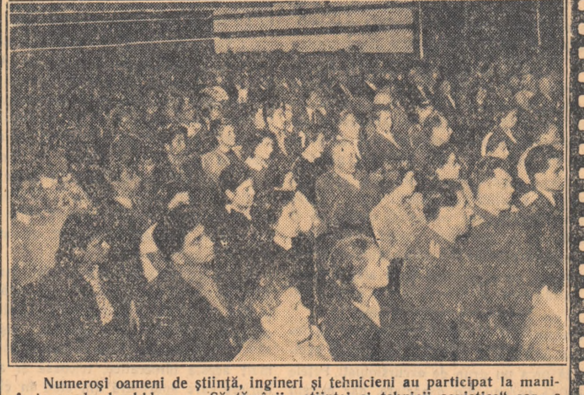
Numeroși oameni de știință, ingineri și tehnicieni au participat la manifestarea de deschidere a „Săptămînii științei și tehnicii sovietice” care a avut loc la Casa prietenii romino-sovietice. În clișeu: Un aspect din sală.