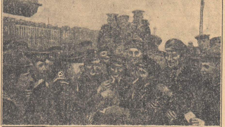
Vizita escadre de nave engleze la Leningrad. În eliseu: subofițeri englezi în mijlocul marinarilor de pe torpilorul sovietic „Solidni”.

— Părăsim cu regret ospitaliera dumneavoastră țară. Noi trebuie să trăim în prietenie — acest lucru e principal. Întorcîndu-ne în Anglia, vom vorbi mult poporului englez despre primirea prietenoasă ce ni s-a făcut.