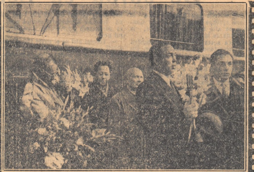
Populeția orașului Cluj a făcut o caldă primire membrilor delegației sovietice la sozrea acestora în gara Cluj. În clișeu: P. I. Kudrevțev, conducătorul delegației, rostește un cuvînt de salut.