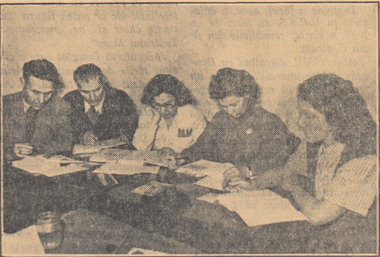
Un aspect de la seminarul cercului de ciclul I de la Complexul C.F.R. „Grivița Roșie” din Capitală.