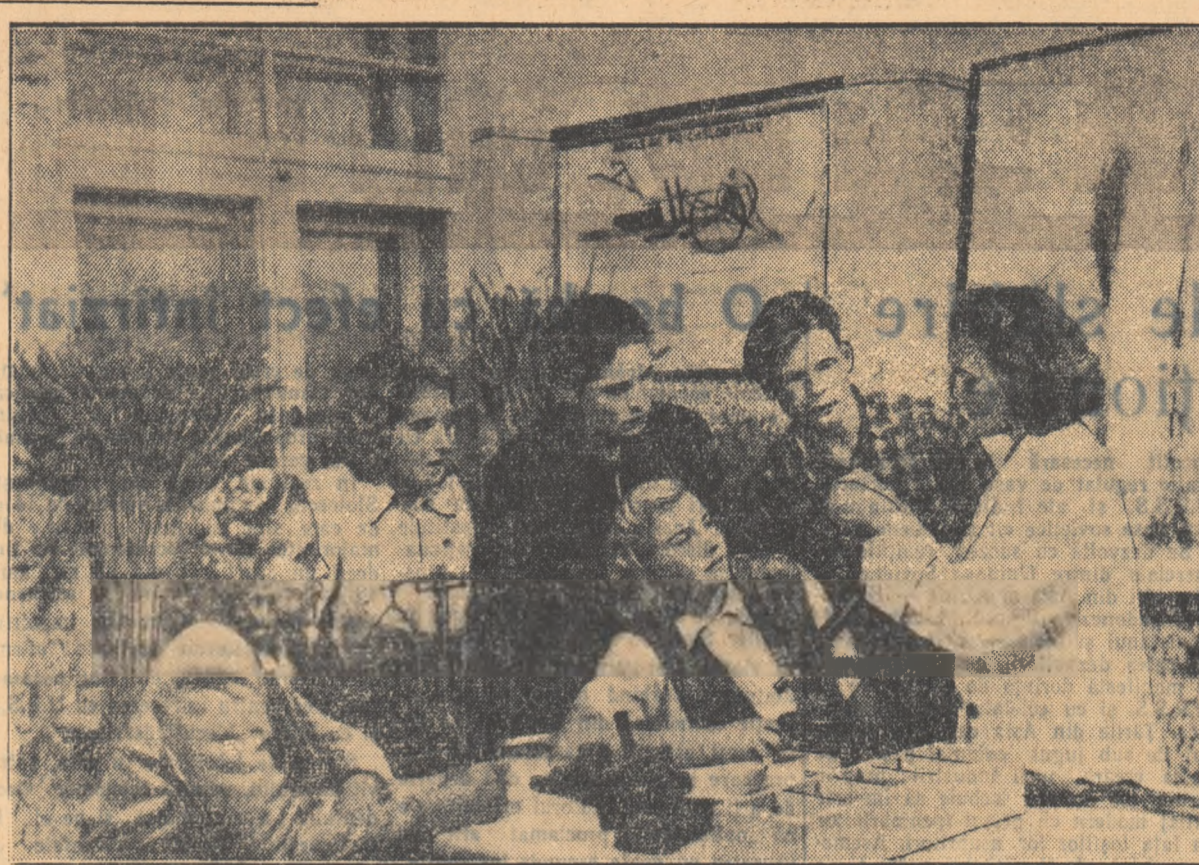
Tineri coloznici din artelul „Nakotne”, raionul Dobels, R.S.S. Letonă participînd la o lecție agrotehnică în laboratorul agronomic al colhozului.

În programul de activitate al clubului sînt prevăzute numeroase și interesante manifestări culturale. Astfel, în luna martie, vor avea loc conferințe și jurnale vorbite despre viața și opera lui N. V. Gogol, despre noutățile literare și teatrale din U.R.S.S. Vor fi organizate seri literare-muzicale, unde vor fi citite versuri din A. S. Pușkin, fragmente din lucrările lui K. Fedin și se vor executa compoziții de Ceaikovski și R. M. Glier. De asemenea, vor avea loc prezentări de filme sovietice în avanspremieră. Toate manifestările au loc în limba rusă.