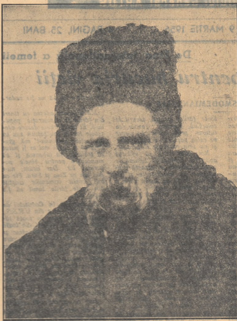
T. G. ȘEVČENKO: Autoportret

ai încerceri unde era rînduit să se culce. La poezia lui Engelhardt, vizitului îl trage o bătaie zdravă. Încercările lui Taras Șevcenko de-a deveni pictor nu l-au lăsat însă rece pe stăpîn. Prezinzînd în el un pictor al casei, așa cum aveau marii nobili, se învîntea în cele din urmă și dă la învățătură la pictorul Șireev din Petersburg.