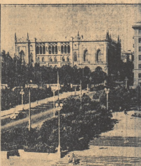
Plaja Tineretului din Baku