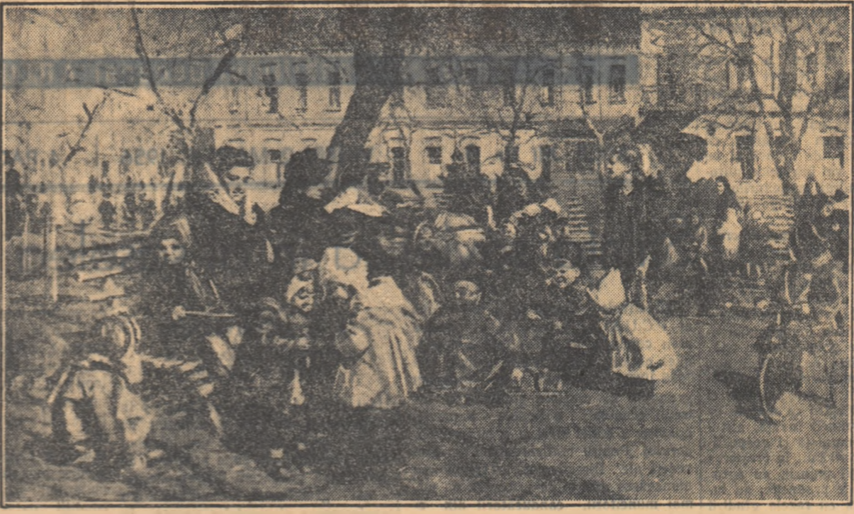
T. N. IABLONSKAIA: „Primăvara.”

conceptia pe care Cehov o avea despre scriitor, și anume că e un om angajat la o anumită tinută morală prin înșiși conștiința profesională sale.