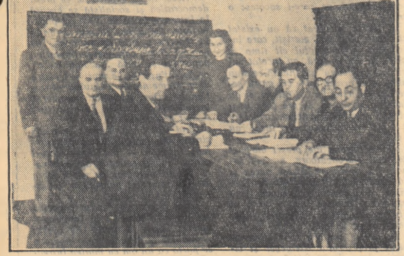
Elevii cursului de limba rusă pentru avansați de la Tribunalul popular — Rădăuți, au început recapitularea lecțiilor în vederea seminarului de sfîrșit de an.