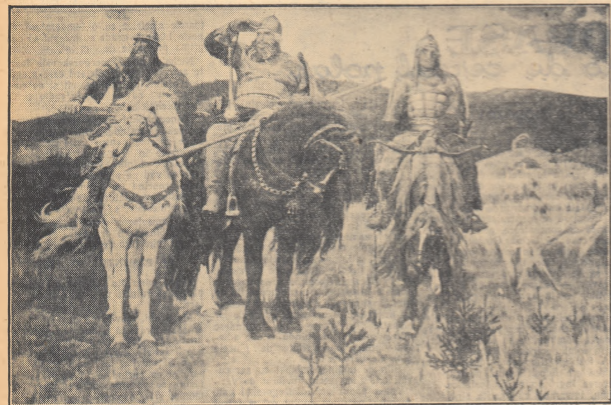
„Voinicii“, pictură de V. Vasnev (Galeria „Tretiakov“)

Am văzut opere de artă a căror amintire a rămas neștersă și al căror renume, datorită valorii lor artistice, a trecut de mult pragul muzeului. E de ajuns să amintesc doar câteva, ca bunăcă: „Dejunul vânătorilor“ de V. Perov, celebrele pinze marine de I. Aivazovski, „Portretul lui L. N. Tolstol“ de Kramskoi, de asemenea, „Dimineața execuției streșilor“ și „Boieroaica Morozova“ (a cărei copie în proporțiile originalului se găsește la Muzeul de Artă al R.P.R.) de Surikov, cunoscutele pinze ale lui I. Repin: „Procesiunea religioasă în gubernia Kursk“, „Întorcerea neașteptată“ și „Ivan cel Groznic“, incontestabil.