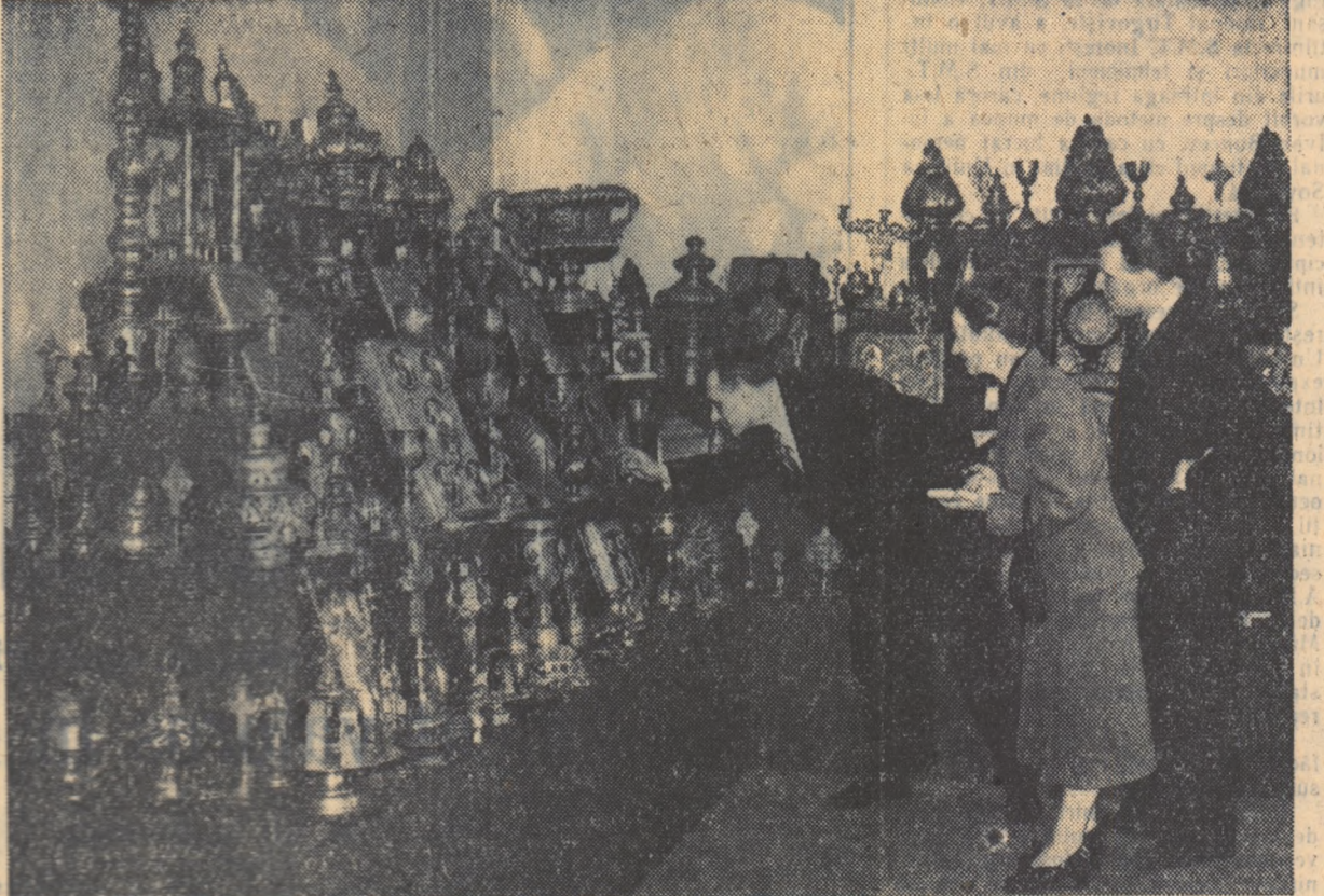
„Am venit în Uniunea Sovietică ca prieteni și am găsit aici prietenie”