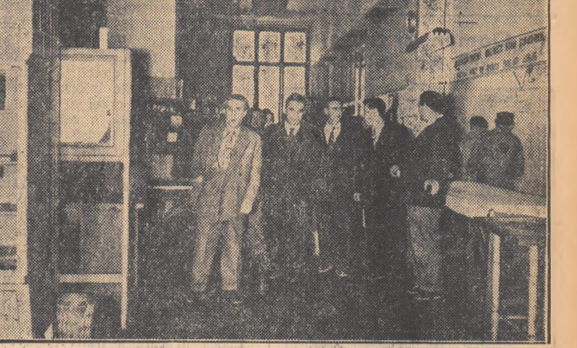
Luni 8 octombrie, delegația sovietică a vizitat Combinatul poligrafic Casa Scintel