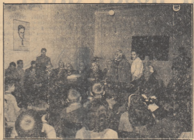
La invitația C.C. al P.M.R. a sosit în țara noastră o delegație de vechi militanți ai Partidului Comunist al Uniunii Sovietice.

El au deopis coroane de flori la placa comemorativă din fața Academiei Militare unde se va ridica monumentul ostașilor romîni căzuți în luptă pentru