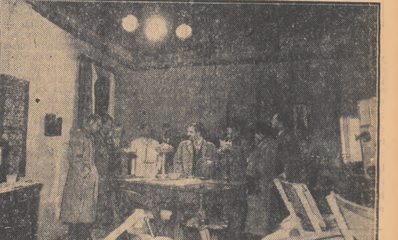
O parte din membrii delegației de oameni de știință și cultură din Uniunea Sovietică, în vizită la Centrul de producție cinematografică „București” de la Buftea