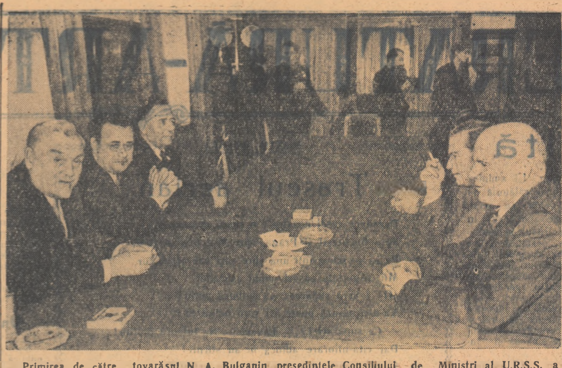
Primirea de către tovarășul N. A. Bulganin, președintele Consiliului de Miniștri al U.R.S.S., a tovarășului Chivu Stoica, președintele Consiliului de Miniștri al Republicii Populare Romine

Libertatea — iată aproape ultimul argument pe care îl pronunță buzele crispate de îngrijorare. Iată greutatea pe care o arunca în jur pentru a face balanța istoriei să se plece de partea lor. Noi simțim liberă să alegem între Eisenhower și Stevenson! Noi