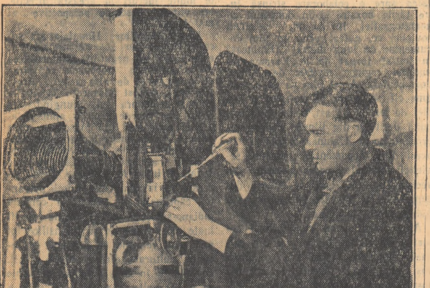
Aceste aparate construite la Fabrica de aparate cinematografice din Moscova, sînt folosite pentru lucrul de înaltă precizie. Noua aparat permite de asemenea combinarea a două imagini în același cadru, realizîndu-se astfel importante economii.