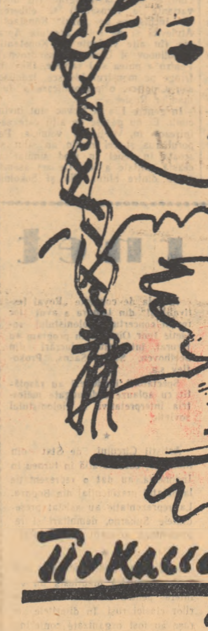
Picasso Afiș pentru prietenia franco-sovietică