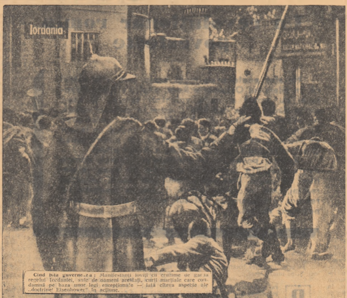
Cînd bîta guvernului: Manifestanții iordanieni cu crizime de gară în fața rezidenței, sînt de oameni aneștia, scrieri mariale care comdămnă pe baza unor legi excepționale — iată cîteva aspecte ale „doctrinei Eisenhower” în acțiune.